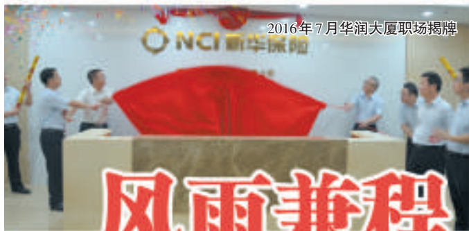
2016年7月华润大厦职场揭牌