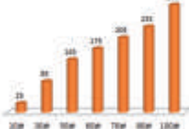
小乐的累计生存金摘要 (单位：万元)

保费豁免： 投保人未61周岁前因意外伤害身故或因意外伤害身体全残，可免交续期保险费，合同继续有效。