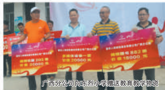
广西分公司向东烈小学赠送教育教学物资