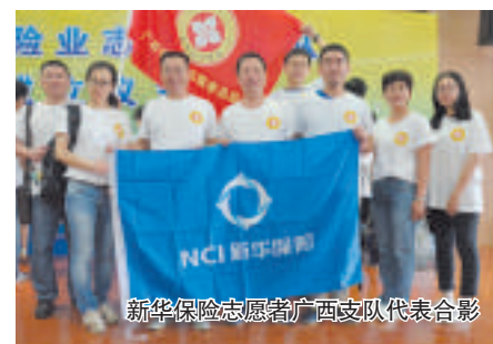
新华保险志愿者广西支队代表合影

2017年，经过广西分公司积极申请，新华保险关爱全国环卫工人大型公益活动在广西南宁落地，共为南宁市1.6万名环卫工人争取到了