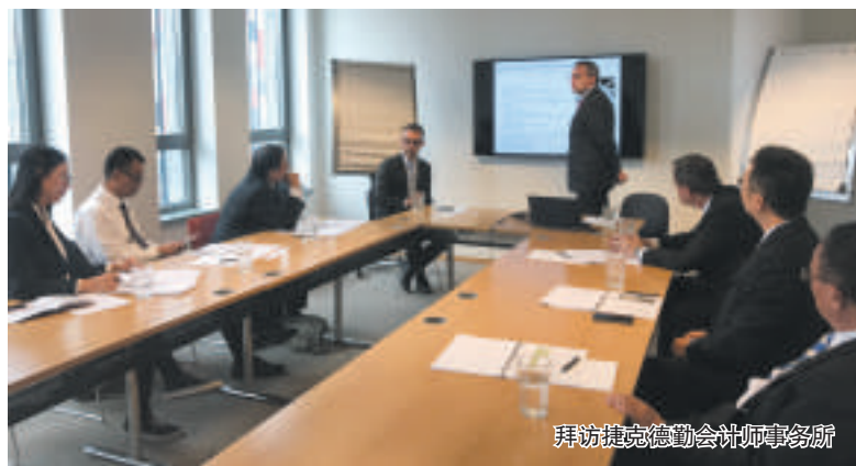
拜访捷克德勤会计师事务所