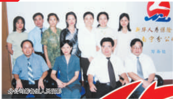
分公司筹备组人员留影